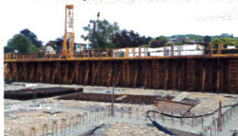
Projet SOLI-CITES SOINS AUDINCOURT