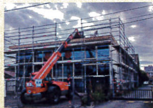
Opération de désamiantage