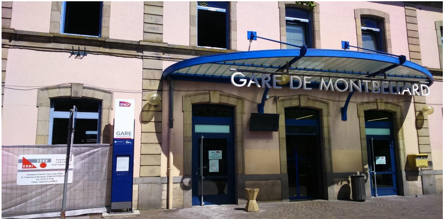
Réaménagement du bâtiment Voyageurs SNCF Gare de Montbéliard